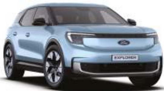
ARCTIC BLUE - lakier metalizowany bez dopłaty Lakier niedostępny dla wersji Collection