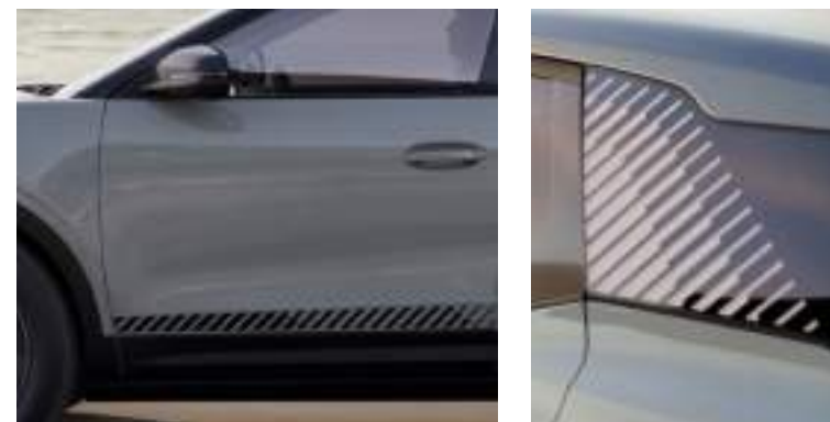
Charakterystyczne akcenty na słupku C oraz po bokach pojazdu Wyposażenie standardowe wersji Collection