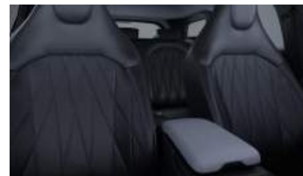
Ford Explorer® w wersji Premium w kolorze Magnetic Grey (wymaga dopłaty) Wnętrze: Tapicerka z elementami ze skóry ekologicznej (wyposażenie standardowe)