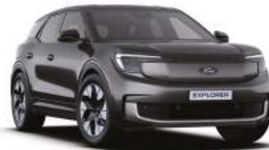
MAGNETIC GREY - lakier metalizowany 3 000 zł Lakier niedostępny dla wersji Collection