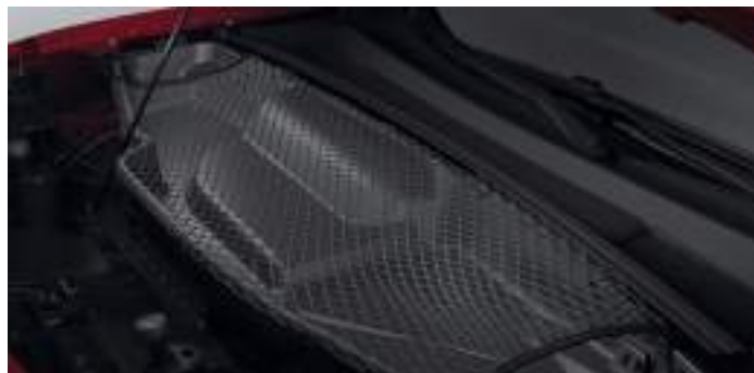
Organizer do bagażnika przedniego (2 825 614)