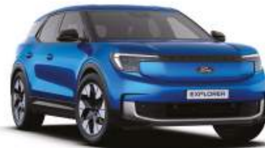
BLUE MY MIND - lakier metalizowany specjalny 4 500 zł Lakier niedostępny dla wersji Collection