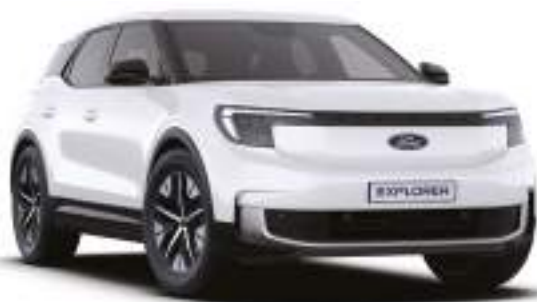
FROZEN WHITE - lakier zwykły 1 500 zł Lakier niedostępny dla wersji Collection