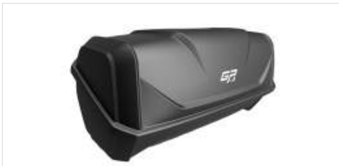
Bagażnik mocowania na haku holowniczym (2 831 824)