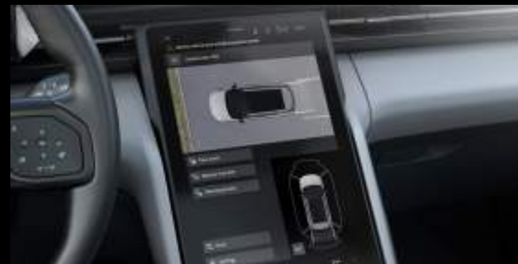
Asystent parkowania z funkcją Memory Wyposażenie opcjonalne dla wszystkich wersji