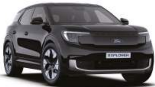
AGATE BLACK - lakier metalizowany 3 000 zł Lakier niedostępny dla wersji Collection