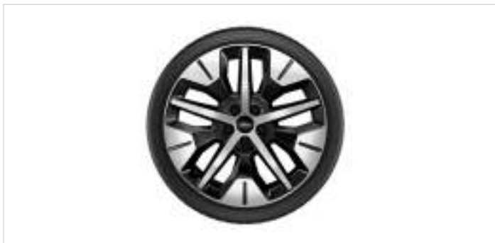
19" koła zimowe z czujnikami ciśnienia

Opony Nokian Snowproof 2 SUV, 235/55 R19 105 V XL (2 712 263)