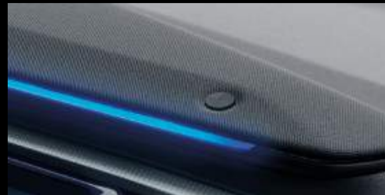
System nagłośnienia Premium B&O Wyposażenie opcjonalne dla wersji Premium i Collection