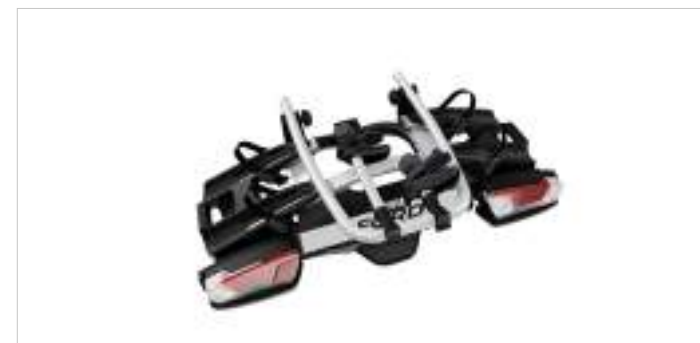
Thule®* Mocowany z tyłu pojazdu bagażnik rowerowy (2 353 442)