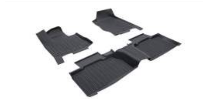
Dywaniki podłogowe, gumowe przednie i tylne (2 328 965)