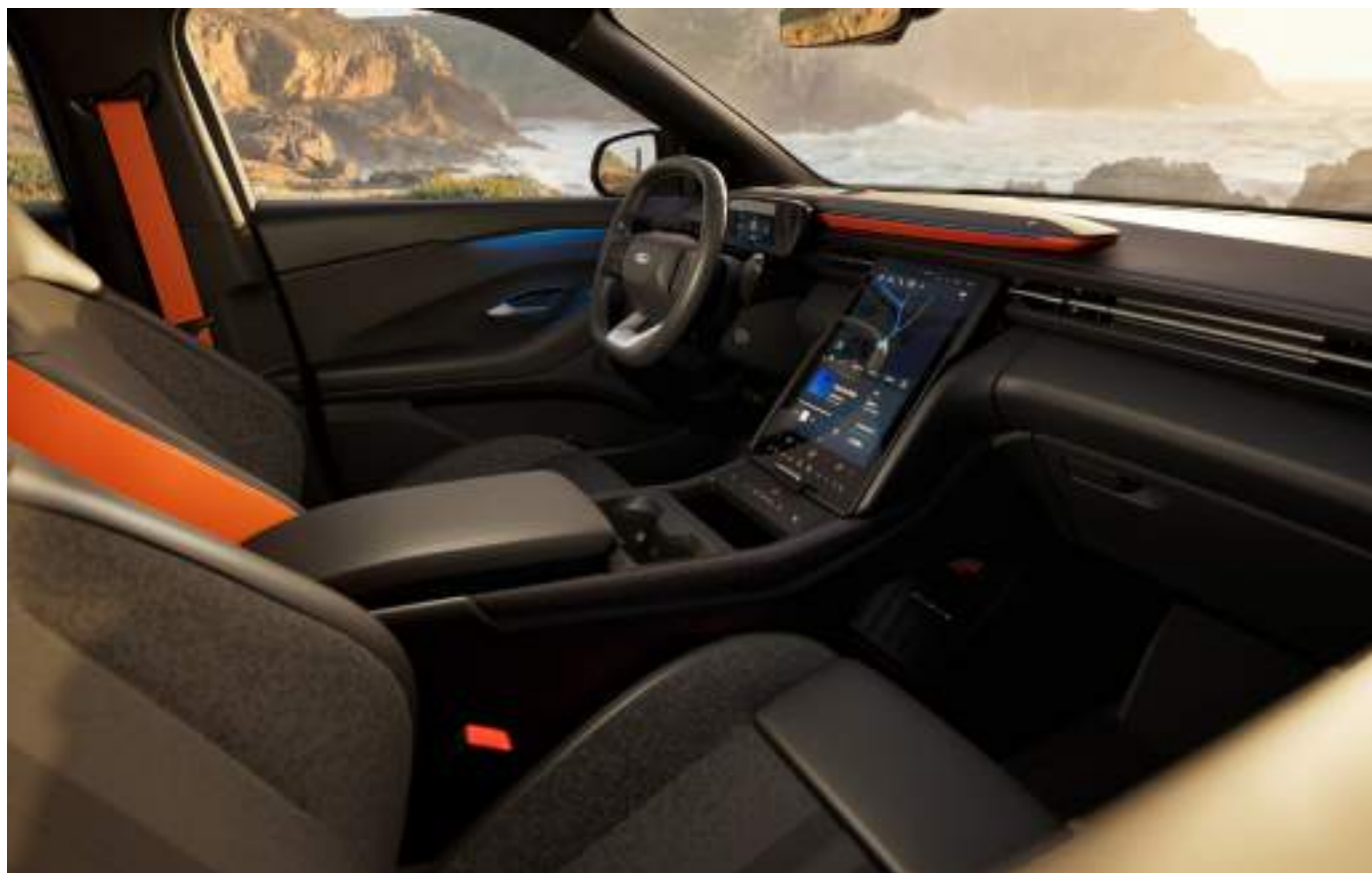
Ford Explorer® w wersji Collection