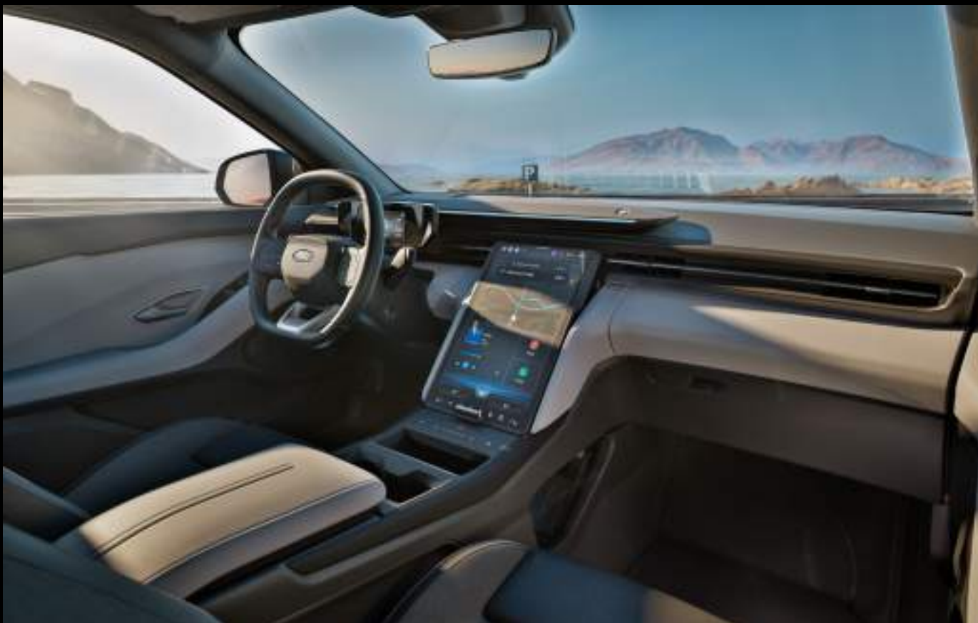
Ford Explorer® w wersji Premium z opcjonalnym wyposażeniem

Centralnym punktem kabiny jest dotykowy wyświetlacz 14,6" z systemem SYNC Move — z bezprzewodowym Android Auto™ i Apple CarPlay™ zawsze pod ręką. Asystent parkowania zyskał funkcję Memory, która zapamiętuje i automatyzuje powtarzalne manewry - wjazd do garażu nigdy nie był prostszy. Nowością jest także One Pedal Driving — system, który pozwala prowadzić praktycznie bez dotykania hamulca. Odpuszczenie pedału gazu uruchamia rekuperację, która odzyskuje energię i zwalnia pojazd płynnie i bezwysiłkowo. Stworzony z myślą o codziennych podróżach po mieście..