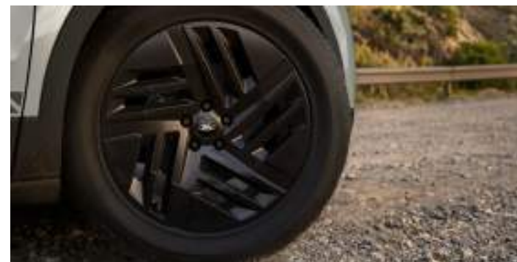
20"obrycze kół ze stopów lekkich Wyposażenie standardowe wersji Collection