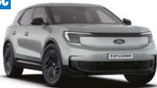
CACTUS GREY - lakier metalizowany Bez dopłaty Lakier niedostępny dla wersji Collection